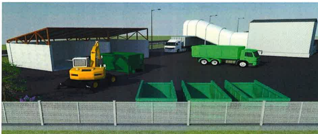
Slika 4: 3-D prikaz sadržaja buduće pretovarne stanice Sinj (simulacija na osnovi Glavnog projekta Pretovarne stanice Sinj, Geoprojekt d.d., 2020.)

Riješeno imovinsko-pravno stanje omogućit će provedbu daljnjih koraka koji imaju za cilj sklapanje ugovora o osnivanju prava građenja i ishođenje građevinske dozvole.