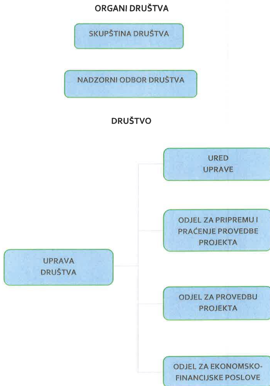
Slika 1: Organi Društva i unutarnja organizacija Društva

OIB: 54045399638 • MB: 023725576 • IBAN: HR5824070001100642101