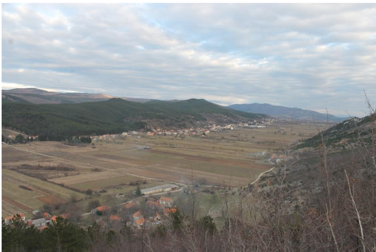
Pogled s gradine Kmeti na Mućko Polje